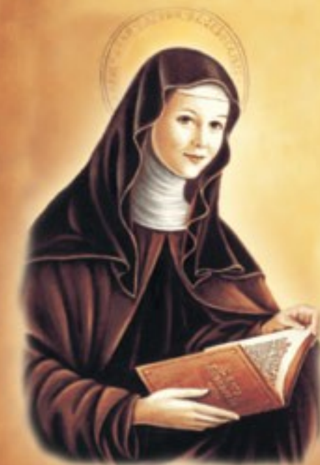
Santa Chiara d'Assisi